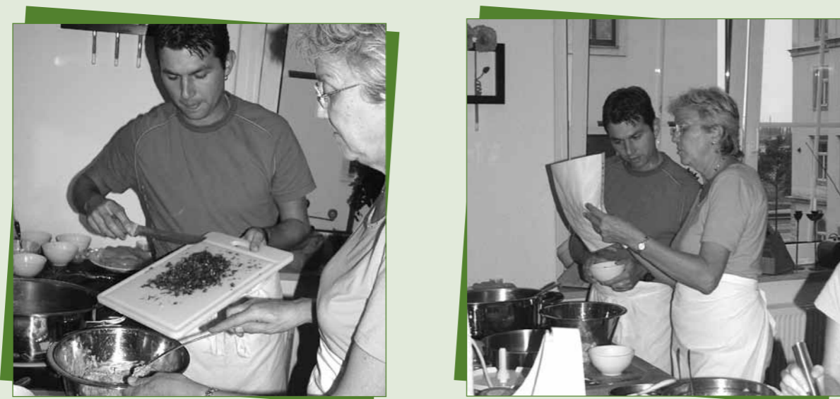
Fortbildung mit den Projektlehrern zum Thema „Lecker und gesund kochen“