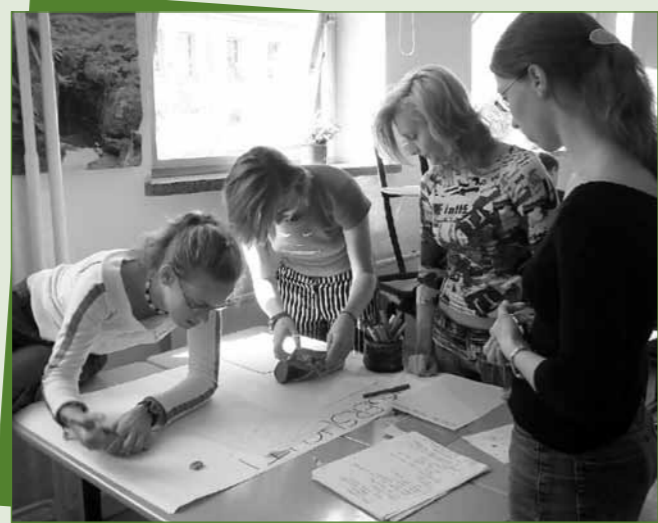
Kampagne „Junge Sachsen genießen – Fit mit Genuss in Kita und Schule“ Arbeitsvorlage: Einordnung eigener Projekte in die Lernportalstruktur