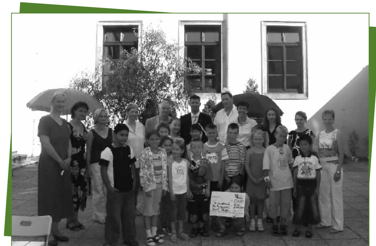
26. Grundschule Dresden: Gewinner des Wettbewerbes „Gesundes Schulfrühstück“ des Deutschen Kinderhilfswerkes.

Auch im Themenschwerpunkt Ernährungs- und Verbraucherbildung werden von verschiedenen Institutionen, Vereinen und Stiftungen Wettbewerbe ausgeschrieben, bei denen es Geld- und Sachpreise zu gewinnen gibt.